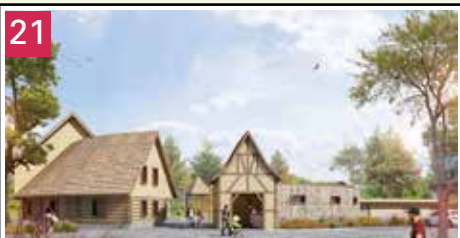
Edification de la ferme du Kohlacker ou Maison des Natures et des Cultures. Début des travaux mai 2015.